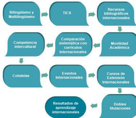
Figura 1. Estrategias para la internacionalización del currículo. Elaboración: Luisa Fernanda Echeverría K. (MEN)

En la siguiente gráfica se presentan los aspectos generales que deben tenerse en cuenta a la hora de evaluar y actualizar los componentes del currículo para darle una perspectiva internacional: